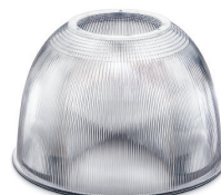
45° Polykarbonat Art.nr: 4084