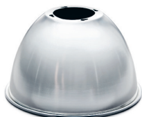
45° Aluminium Art.nr: 4081