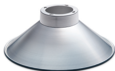
90° Aluminium Art.nr: 4082